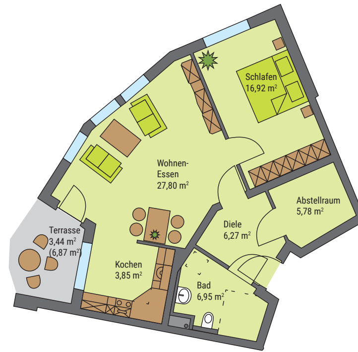
Beispiel für eine 2-Personen-Wohnung mit 75,25 m 2 im Erdgeschoss in Haus 1